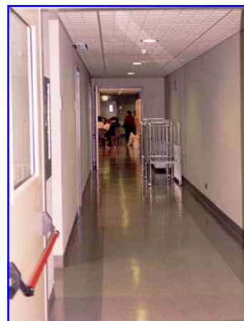
il nuovo reparto

Con l'ambulanza sono stata accompagnata dall'ospedale vecchio a quello nuovo. Miriam