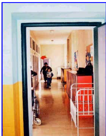
il vecchio reparto